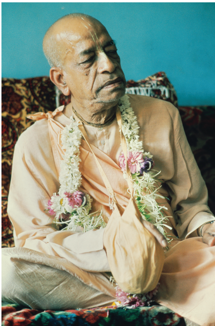
Sa Divine Grace A.C. Bhaktivedanta Swami Prabhupāda Fondateur-Acarya de l'Association Internationale pour la Conscience de Krishna (ISKCON)